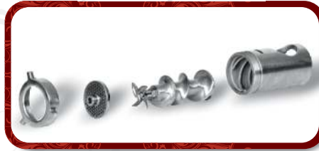
Removable Head Unit